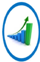
ความมั่งคั่ง