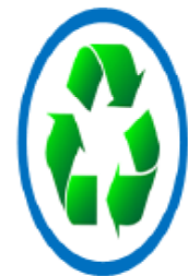
ความยั่งยืน